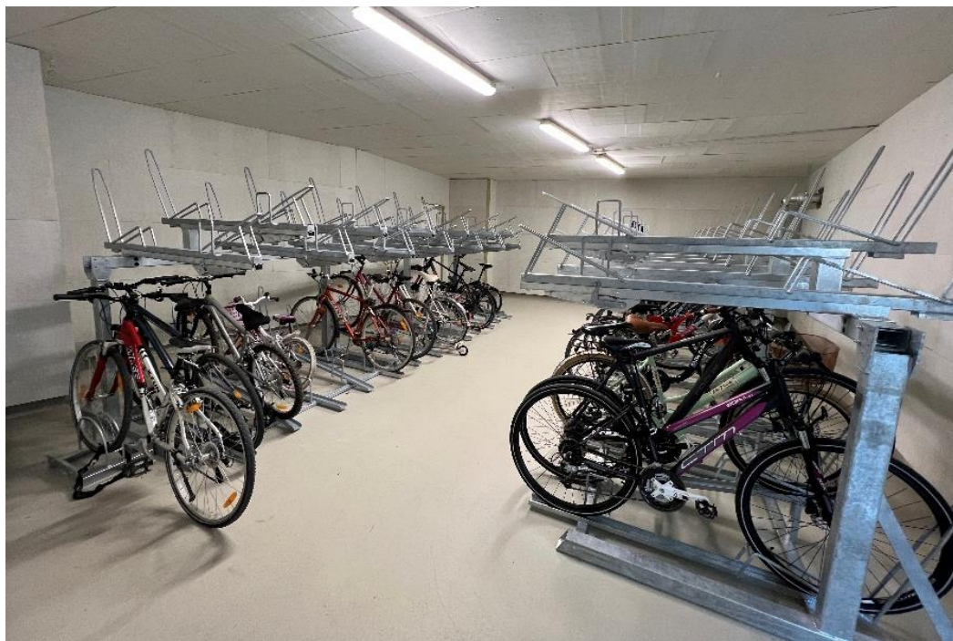
Bildquelle: Jesusmohamed Singh Nutzungsbewilligung erhalten