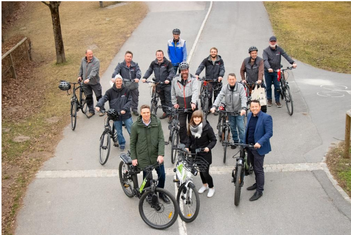
Bildquelle: Wilhelm Giuliani (Stadt Innsbruck) Nutzungsbewilligung erhalten